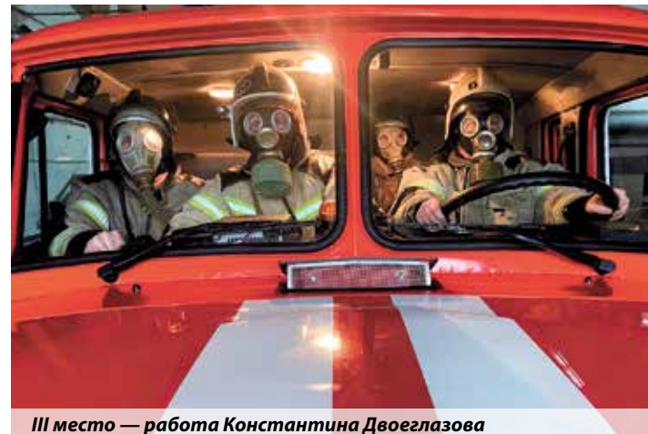
III место — работа Константина Двоглазова