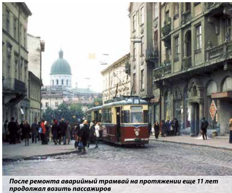
После ремонта аварийный трамвай на протяжении еще 11 лет продолжал возить пассажиров

10 января 1972 года на главной городской магистрали — улице 1 Мая (ныне Горьковская) примерно в 16.00 трамвай № 6 с прицепным вагоном не затормозил на затяжном (протяженностью более километра) склоне и начал набирать скорость. У перекрестья с улицами Шевченко и Леонтовича посреди проезжей части был островок с трамвайной остановкой. На высокой скорости трамвай сошел с рельс и врезался прямо в этот островок, убивая и калеча стоявших на остановке людей. Далее он доехал до кирпичной ограды школы № 43, расположенной на другой стороне улицы, пробил ее, въехал на школьный двор. К счастью, зимние